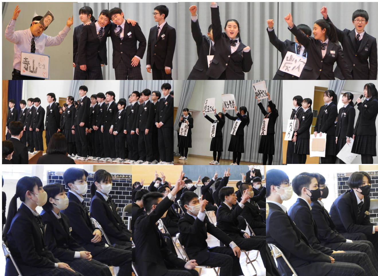
1・2年生の思いと3年生の優しく温かな反応とが響き合う素晴らしい集会となりました！

3月7日（木）生徒会執行部企画の「3年生を送る会」を開催しました。1・2年生が、工夫を凝らして、3年生にまつわる寸劇やクイズを披露しました。思い出深い名シーンに、3年生も大喜びでした。昨年度まで北陽中にいらした先生方からのメッセージが流れた時は、懐かしさに涙がこぼれた生徒も…。とてもよい「3年生を送る会」でした。