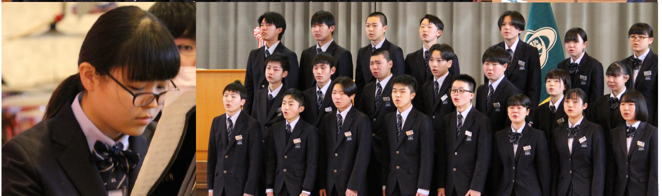
3年間の集大成として最高の振舞いを発揮して立派に巣立っていった48名の卒業生たち！